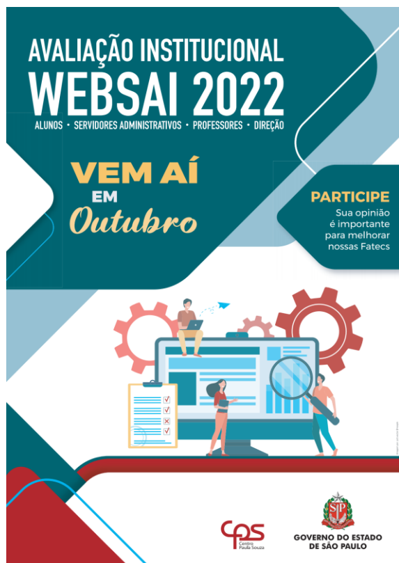
Figura 2- Cartaz de divulgação da CPA