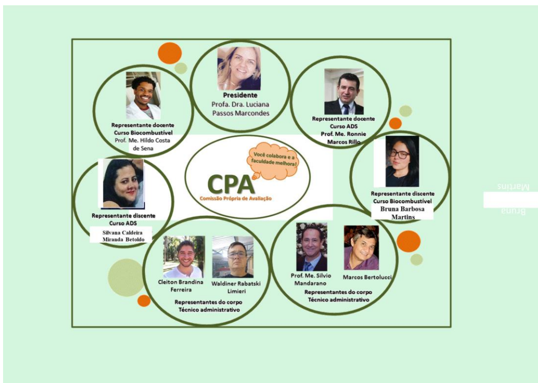
Figura 3- Cartaz de divulgação dos membros da CPA