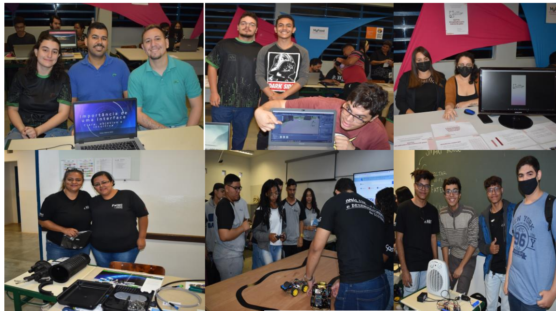
Figura 4: Fatec Aberta Araçatuba